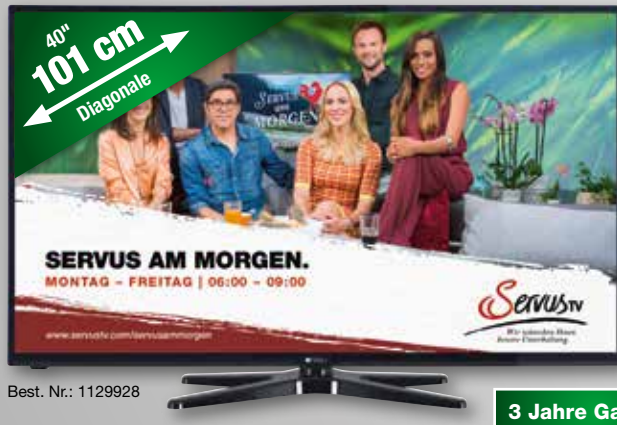
Best. Nr.: 1129928