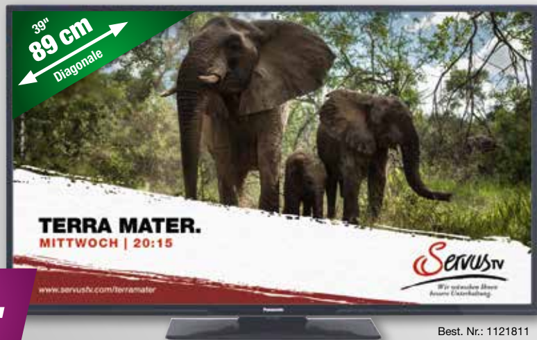
Best. Nr.: 1121811