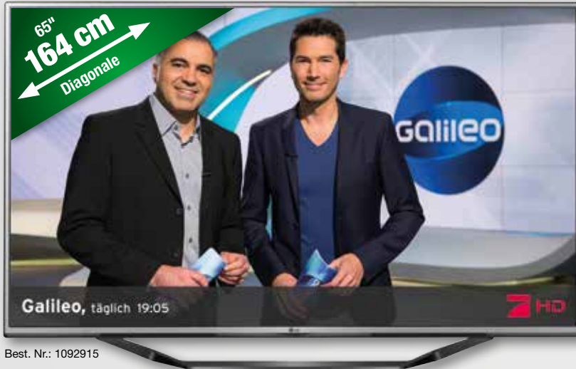
Best. Nr.: 1092915