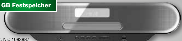
Best. Nr.: 1083887