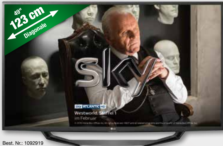
Best. Nr.: 1092919