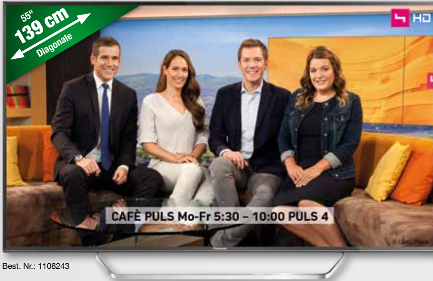
Best. Nr.: 1108243

Dynamic Bass Sound & Wide Range Bass Reflex Lautsprecher